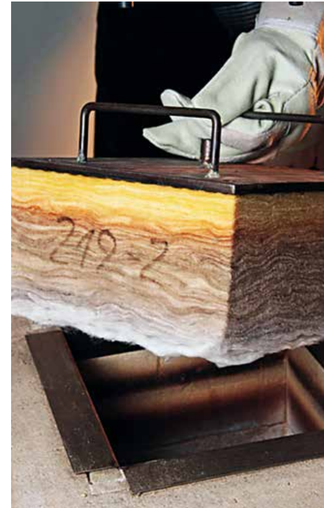
Anwendungsgrenztemperatur | Maximum service temperature