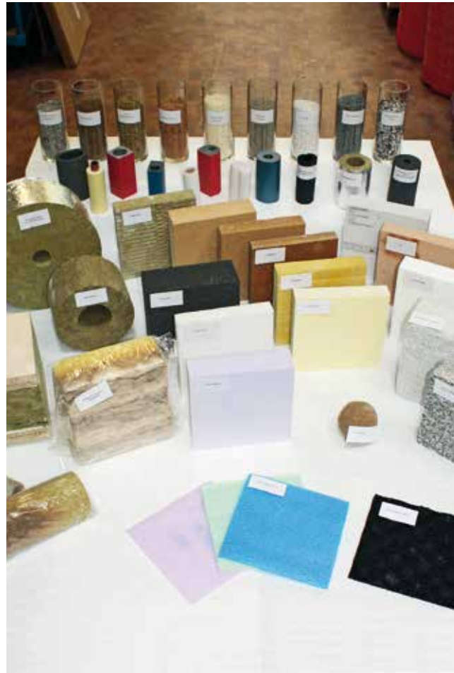
Übersicht Wärmedämmstoffe | Overview of thermal insulation materials