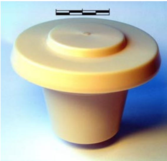
Radon-Ortsdosimeter komplette Diffusionskammer